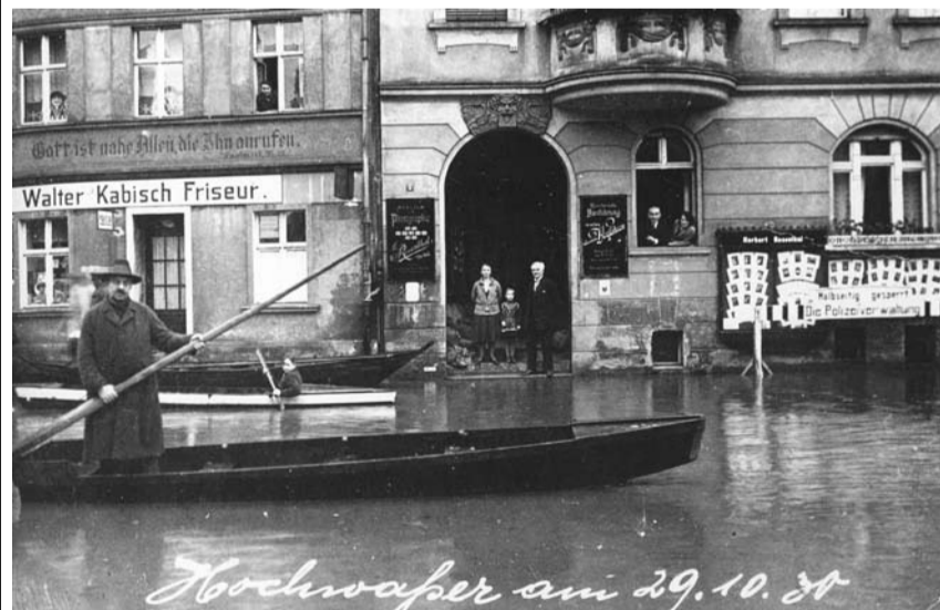
(2) Powódź w październiku 1930 r. - skrzyżowanie dzisiejszych ulic Piastowskiej i Grunwaldzkiej

Na podst. różnych wydawnictw regionalnych Opr. i przekład: K. Freyer