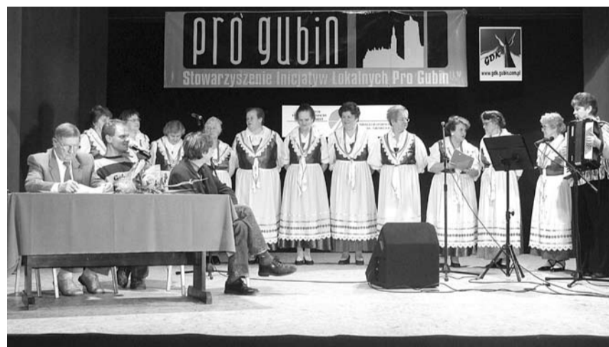
Gubińskie Łuzyczanki zaśpiewały szlagiery

FUNDACJA WSPÓŁPRACY POLSKO-NIEMIECKIEJ STIFTUNG FÜR DEUTSCH-POLNISCHE ZUSAMMENARBEIT