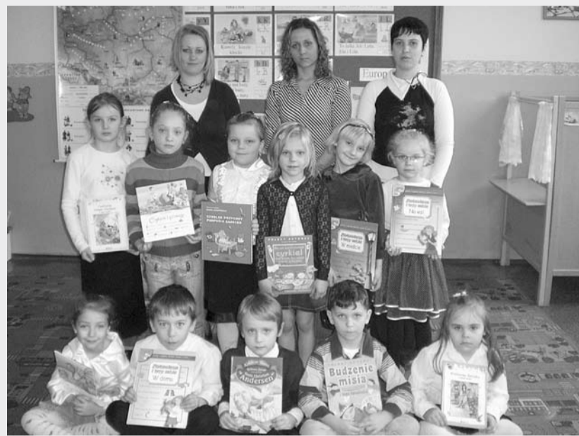
Na zdjęciu wszyscy uczestnicy eliminacji z klasy „o”

Każdego roku odbywa się Lubuski Konkurs Recytatorski, którego Przegląd Rejonowy ma miejsce w marcu w GDK, w Gubinie. Jest to konkurs dla uczniów szkół podstawowych i gimnazjów. Uczestnicy kwalifikują się do 3 grup wiekowych: 1) klasy I-III, 2) klasy IV-VI, 3) gimnazjum. W naszym mieście także klasy „o”, które na tym etapie kończą konkurs. Repertuar jest dowolny: wiersz lub jego fragment, lub fragment prozy.