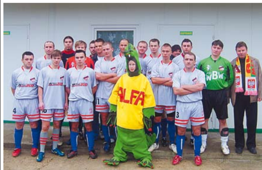
Piłkarze Alfy z żywą maskotką