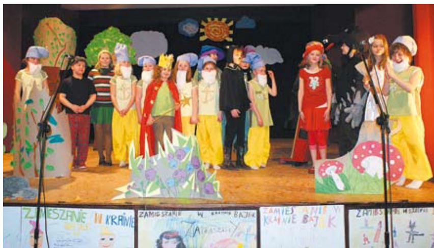
„Zamieszanie w krainie bajek” wypadło znakomicie

A zamieszanie w krainie bajek to wywołały dwie wróżki... Koszmarne. Tylko proszę nikomu nie mówić! MG