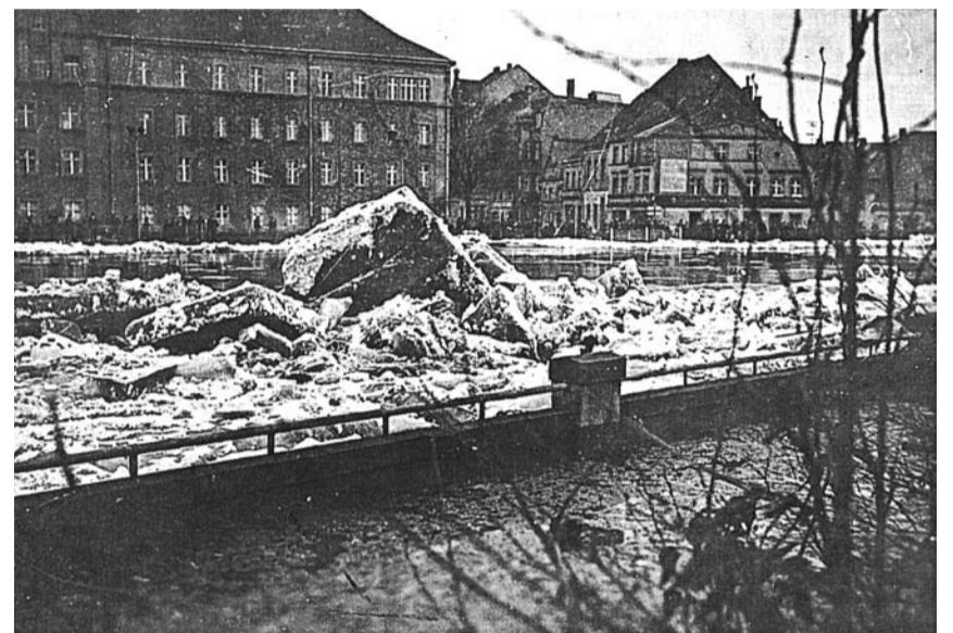
(1) Lodowe masy na Nysie - foto (własność Fritz Hampel) wykonano pod koniec lat 30. XX wieku, po lewej na drugim planie ówczesny urząd miejski, czyli dzisiejszy budynek internatu ZSLIT

raz w tym roku pokazała się ze złej strony. Bardzo obfite opady w Suedetach przyniosły nam 1. i 2. sierpnia powódź, tak zgrabną, jakiej nie było od roku 1595 i 1804. W krótkim czasie stan wody wzrósł z 10 cm do 3,45 m”. Wtedy woda wdarła