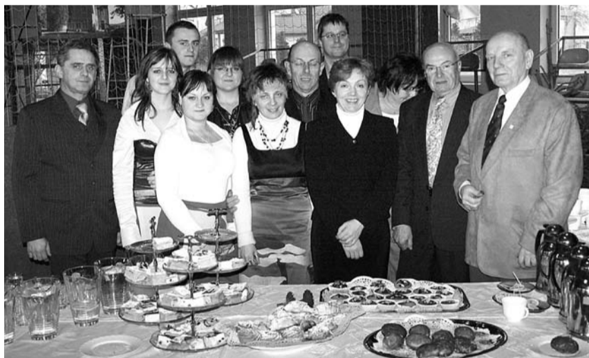
Przyjaciele wiedzą jak trafić przez żołądek do serca

Wszyscy goście ciepło mówili o współpracy polsko-francuskiej. Po części artystycznej (w obu językach)