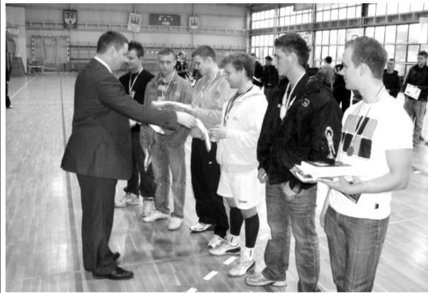
Wręczanie nagród w grupie seniorów