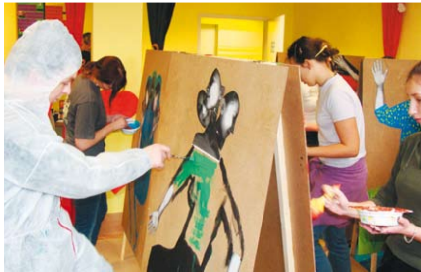
Wspólne polsko-niemieckie malowanie