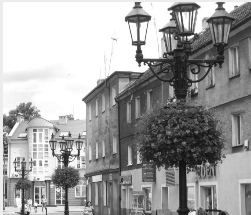
Konstrukcje TERRY na gubińskim deptaku

To nie jest jedyne wyróżnienie dla gubińskiej firmy. TERRA w ostatnim okresie została nagrodzona i wyróżniona na kilku najważniejszych wystawach i branżowych imprezach targowych. Wśród nich znalazły się m.in.: tytuł najbardziej innowacyjnej firmy Województwa Lubuskiego w roku 2007, Złoty Laur podczas Międzynarodowej Wystawy Zieleń to Życie 2008 w Warszawie za najlepszy produkt w kategorii ogrody i tereny zielone.