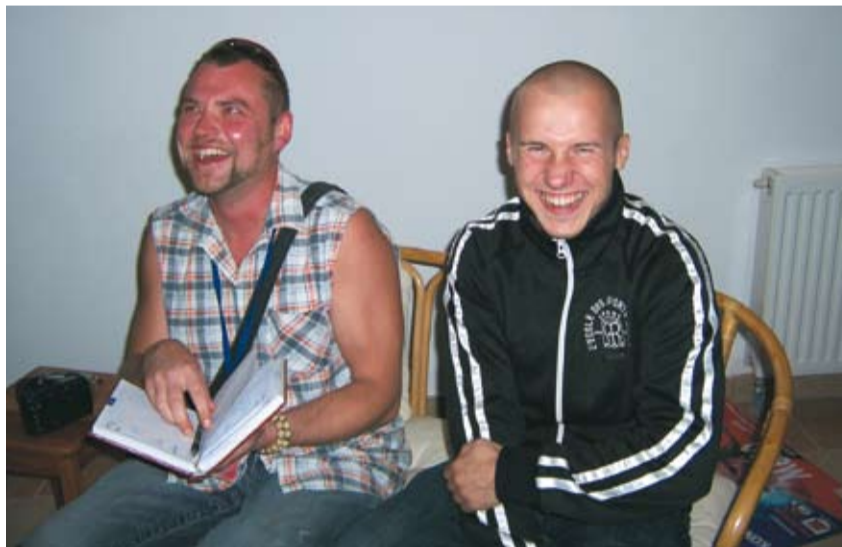
Autor wywiadu z raperem jak widać w dobrym humorze

G: Co jeszcze chciałbyś przekazać gubinianom?