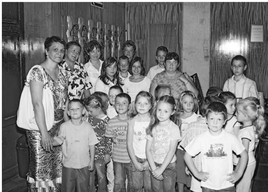
Młodzi wykonawcy z opiekunkami chwilę po zakończeniu występu