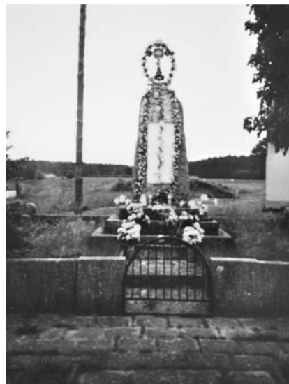
Wiejska kapliczka w Zawadzie

Perłowy Młyn, stary młyn wodny, był lubianym celem wycieczek. Dziś dom mieszkalny i młyn przysypały gruz i śmieci, a młynowe stawy wyschły. Perłowy Potok płynie jeszcze żwawo. Zasilają go wody Jeziora Wełmickiego. Potok przepływa przez Grochów, Kaniów, Zawadę, Żenichów i wpada do Lubszy.