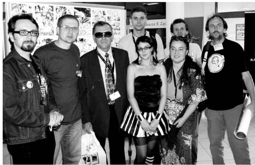
Gubiński rysownik - trzeci od lewej

z jego udziałem - okazją było otwarcie wystawy nowej części Tajfuny pt. „Jądro”. Twórca opowiadał o procesie twórczym i pomyśle na komiks, odpowiadał na pytania zainteresowanych i podpisywał plakaty z wystawy w Gubinie, która odbyła się w poprzednim roku. (DCH)