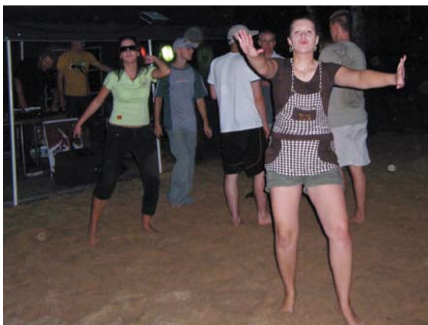
Pomimo złej aury ochoty do zabawy nie brakowało

■ miejsce: plaża „Oaza” ■ organizator: OTWARTE, GDK ■ sponsorzy: Sklep „U Grzegorza”, Intergeo, Sklep „Patrol”, pub „Azył”, Salon Fryzjerski „Blue”