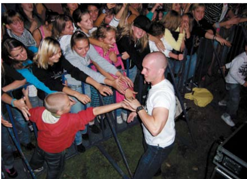
Każdy choć na chwilę chciał być blisko gwiazdy