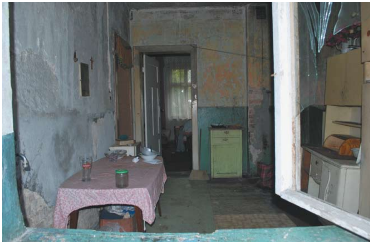
Mityczny Herkules miałby pewnie problem z uprzątnięciem stajni współczesnego Augiasza...

Problem z nieuczciwymi najemcami lokali nie jest nowy, ale pomysł na jego rozwiązanie, choć nowatorski i kontrowersyjny, to jednak skuteczny!