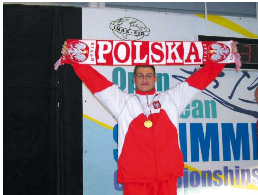
Na Marcina zawsze można liczyć!