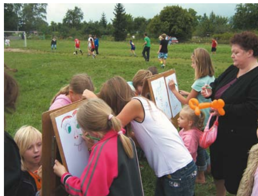
Wspomnienia z wakacji przelewane na kartkę papieru

■ miejsce: Osiedle nr 4 ■ organizator: Gubiński Dom Kultury, Miejski Ośrodek Sportu