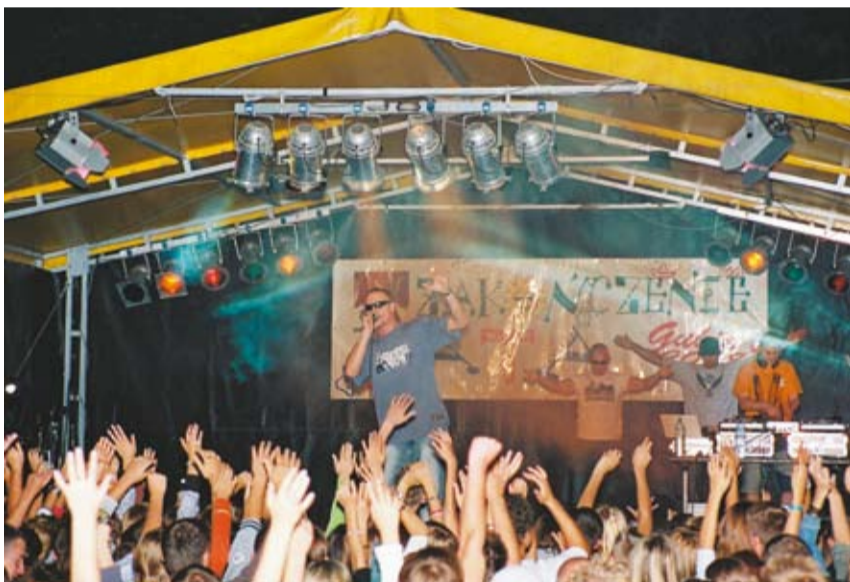
Publiczność reagowała żywiołowo