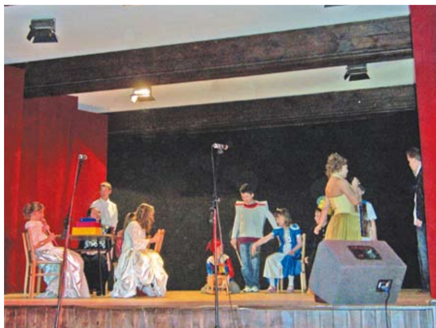
Teatr to wspaniała przygoda

■ organizator: Gubiński Dom Kultury www.gdk.gubin.com.pl ■ miejsce: sala widowiskowo-kinowa GDK