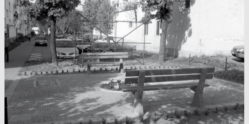
Dowodem na sprawne działanie mieszkańców niech będzie nowo powstały skwerek przy ul. Westerplatte 12

Miło, gdy zauważana jest praca społeczna mieszkańców Gubina na rzecz upiększania środowiska naturalnego.