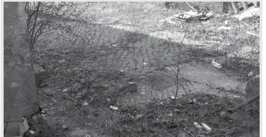
Śmietnisko przy ulicy Wyspiańskiego