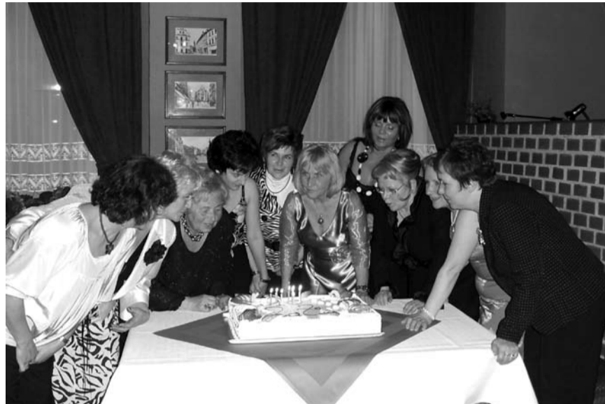
...i zaraz go pokroją

uczestników zaproszono również wykonawców z programem artystycznym, a wszyscy uczestnicy zabiorą ze sobą statuetkę dla szkoły i indywidualną nagrodę dla siebie, albowiem dobre wychowanie jest między innymi przeciwstawieniem się przemocy w szkole. Widać więc, że klubowiczki zaczynają działania na wielu frontach, nieustannie poszerzając ich zakres.