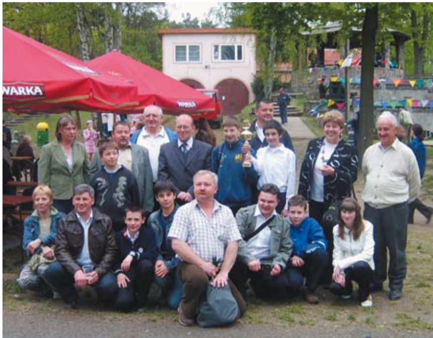
Gubińska Orkiestra Dęta przy ZSR z trofeum. Brawo, gubińscy muzycy!

Na festiwalu była najmłodszą orkiestrą, gdyż liczy sobie niespełna rok. Powstała 4 czerwca ub. roku. W jej skład wchodzi trzy pokolenia muzyków, w tym m. in. uczniowie i absolwenci Państwowej Szkoły Muzycznej, uczniowie i absolwenci ZSR w Gubinie oraz muzycy z byłej Wojskowej Orkiestry Dętej. Pierwsze wyróżnienie orkiestra otrzymała jeszcze w 2007 roku, w Szprotawie na Ogólnopolskim Festiwalu