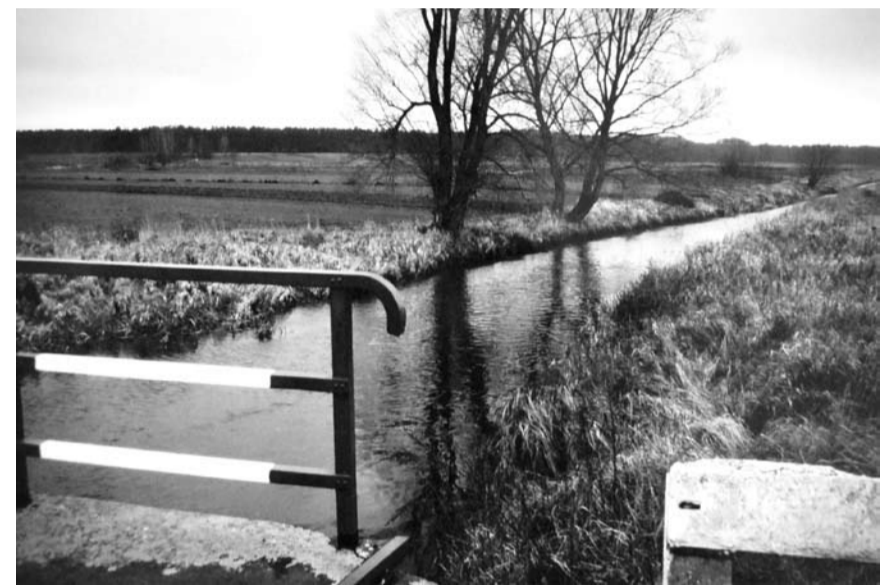
Łomianka pomiędzy Chlebowem i Odrą

A co pozostało z pobliskiej owczarni na wrzosowisku? Co pozostało z gospodarstwa rolnego rodziny Türke z domem mieszkalnym, stodołą, oborą, szopa?