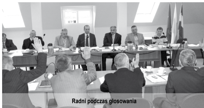
Radni podczas głosowania

Ostatecznie Zarząd Powiatu Krośnieńskiego otrzymał absolutorium