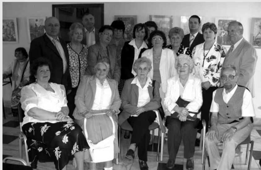
Pamiątkowe zdjęcie po spotkaniu

Związek stawia sobie za cel m.in. poprawę warunków socjalno-bytowych członków, uczestnictwo w życiu społecznym, współdziałanie z władzami samorządowymi i administracyjnymi, związkami zawodowymi, organizacjami społecznymi i gospodarczymi, organizację życia kulturalnego.