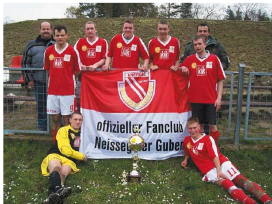
Zwycięska drużyna z pucharem