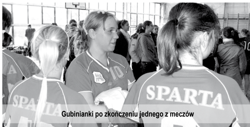
Gubinianki po zakończeniu jednego z meczów