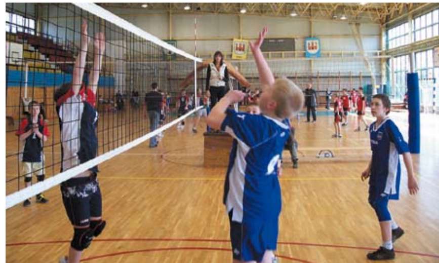
Młodzi siatkarze w dynamicznej akcji

W turnieju zagrały drużyny z: MKST „Astra” Nowa Sól, OSiR Lubsko, MLKS „Volley” Gubin, UKS „Jedynka” Szprotawa, UKS „Trójka” Sulechów, UKS „Trójka” Międzyrzecz, UKS „Orliki” Międzyrzecz oraz SP 1 Sulechów.