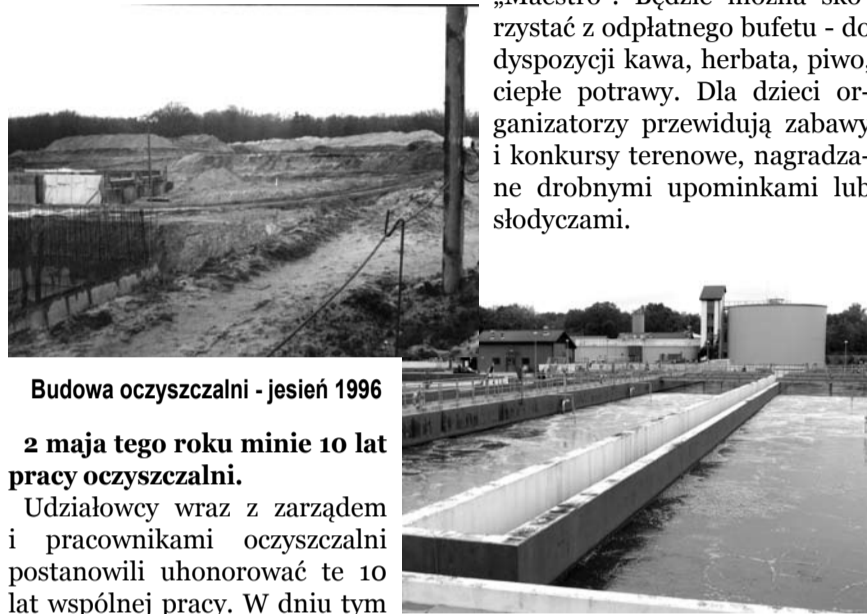
Budowa oczyszczalni - jesień 1996

W godzinach od 15.00 do 19.00 organizatorzy zapewniają: zapoznanie z technologią oczyszczalni i jej osiągnięciami z okresu 10 lat, możliwość obejrzenia wystawy wykopalisk archeologicznych sprzed 3 500 lat znalezionych na terenie oczyszczalni ścieków podczas jej budowy. W czasie zwiedzania towarzyszyć będzie gościom muzyka taneczno-rozrywkowa, w wykonaniu zespołu „Maestro”. Będzie można skorzystać z odpłatnego bufetu - do dyspozycji kawa, herbata, piwo, ciepłe potrawy. Dla dzieci organizatorzy przewidują zabawy i konkursy terenowe, nagradzane drobnymi upominkami lub słodyczkami.