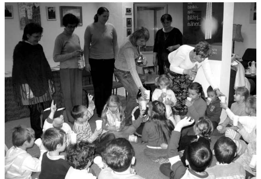
Po lekcji historii dzieci otrzymały niespodzianki