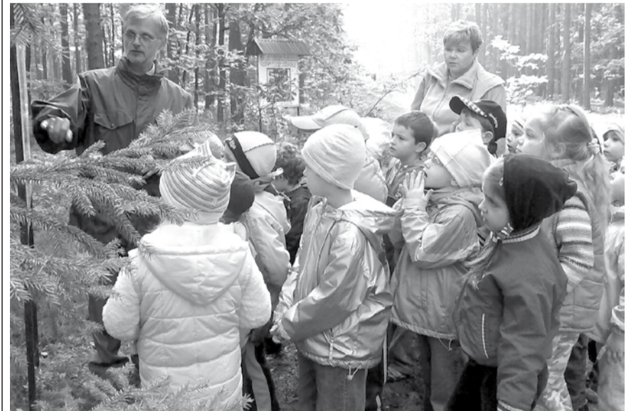
Przedszkolaki tropią ślady wiosny

Koleżanki z niemieckiego przedszkola zawsze przyjmują nas i nasze dzieci bardzo serdecznie, oferując wiele ciekawych propozycji zabaw i zajęć. Kolejne zajęcia odbyły się 16 kwietnia, podczas których dzieci z obu przedszkoli zacieśniały koleżeńskie i przyjacielskie kontakty, które stają się coraz częstsze.