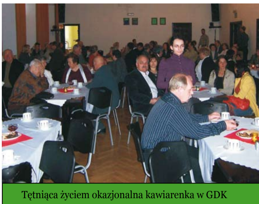
Tętniąca życiem okazjonalna kawiarenka w GDK