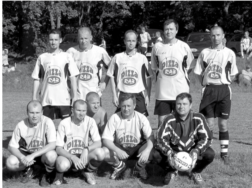
Zwycięzcy poprzednich rozgrywek - drużyna Pizza RAB