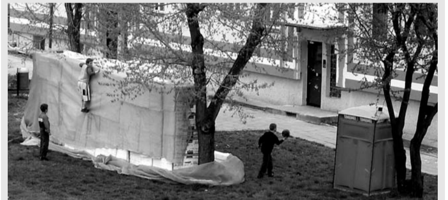
Mamo, tato, poznasz mnie? To ja... wasz synek!

- Codziennie obrazki z życia osiedla, dzieci się bawią - mówi pani Renata, mieszkanka osiedla nr 1. - Ocieplany jest blok mieszkalny, magazynowane są w jednym miejscu materiały temu służące, m. in. styropian. Całe gromadki kilkuletnich dzieci w czasie zabawy wdrapują się na składowane materiały. Do przenośnych toalet wypychane są kije. Psują, co tylko możliwe z wielką pasją... Czy nikt tych dzieci nie nadzoruje, gdzie rodzice? - zadajemy sobie pytanie.