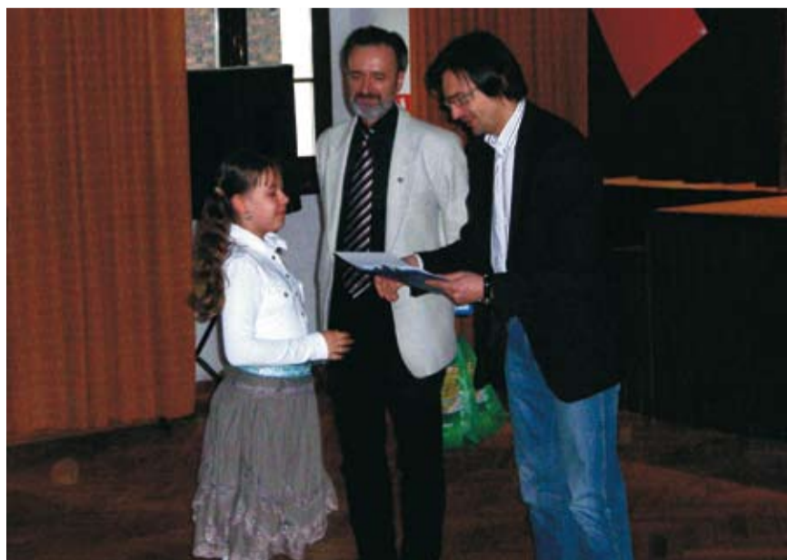
Nagrodę z rąk T. Siemińskiego odbiera jedna z laureatek

Organizator: Gubiński Dom Kultury www.gdk.gubin.com.pl Miejsce: sala widowiskowa GDK Fundator nagród: Starostwo Powiatowe