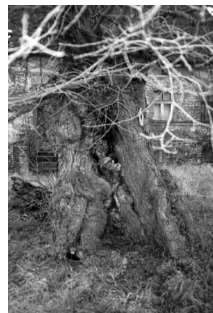
stary wiąz w Coschen

Za wsią jest boisko piłkarskie z budynkiem dla stowarzyszeń. Na wale przeciwpowodziowym Nysy jest