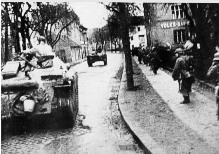
Czołgi na dzisiejszej ul. Roosevelta w lutym 1945 r.

Zatem po 63 latach od tamtych dni pora najwyższa by odejść od tej sztucznie przyjętej daty. A jeżeli już nie możemy obejść się bez świętowania to uczcijmy dzień, w którym radziecki komendant miasta przekazał Polakom władzę. (sp)