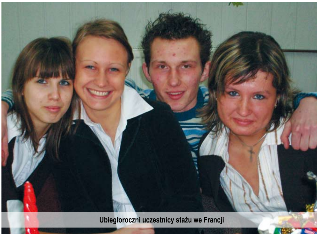
Ubiegłorocznicy stażu we Francji