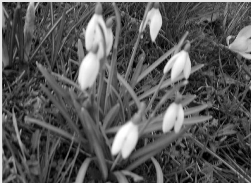
Pierwsze wiosenne kwiatki na rabatach

W różnych częściach miasta pojawiły się na zieleńcach, na rabatach, w ogrodach różne kwiaty. Luty – środek kalendarzowej zimy - a kwiaty kwitną. Wiosna objawiła się w całej krasie, drzewa zaczynają dostawać pąki, trawy się zielenią i te śliczne kwiaty... Czas na porządki w ogródkach i na rabatach?