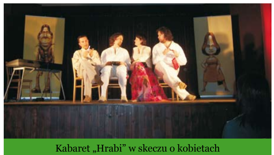
Kabaret „Hrabi” w skeczu o kobietach