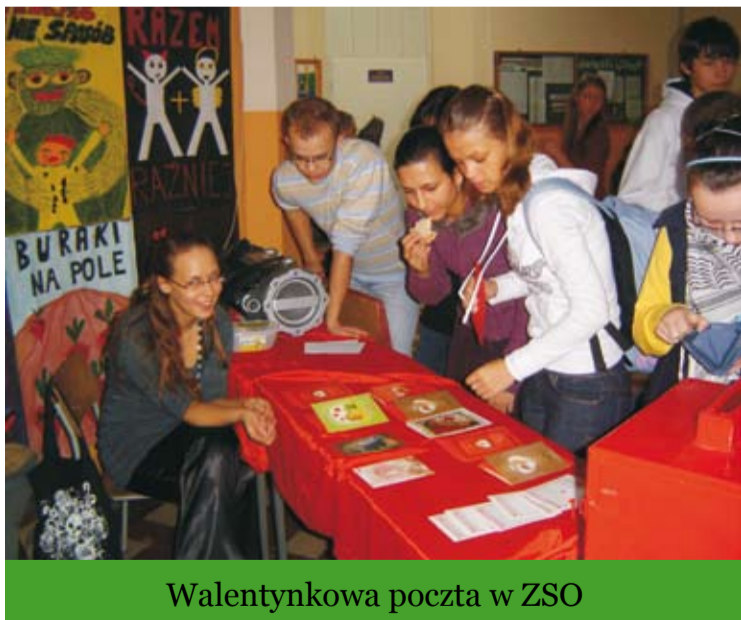
Walentynkowa poczta w ZSO

Zgodnie z przeszezczeniem z oceanu tradycją wszyscy zakochani, lekko zauroczeni oraz ci czekający dopiero na wielką miłość, mają swój dzień. Popularne „Walentynki” każdy obchodzi w wymarzonej konwencji, zgodnie z emocjonalnym zaangażowaniem, wspólnymi z partnerem marzeniami. Ale Dzień Zakochanych to także chwila będą-