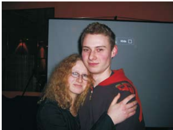
Najlepiej dobrana para

odnowę biologiczną, biżuteria, złote rybki, etc. Wszystko w elegancko przygotowanej scenarii wspomnianej restauracji.