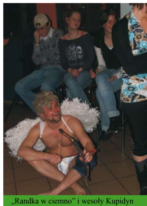
„Randka w ciemno” i wesoły Kupidyn