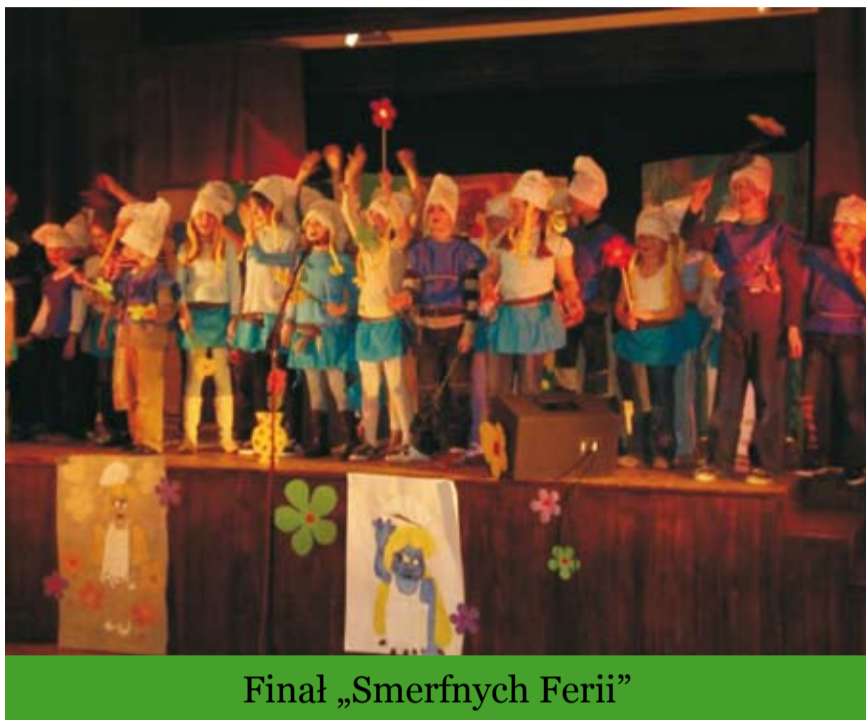
Finał „Smerfnych Ferii”