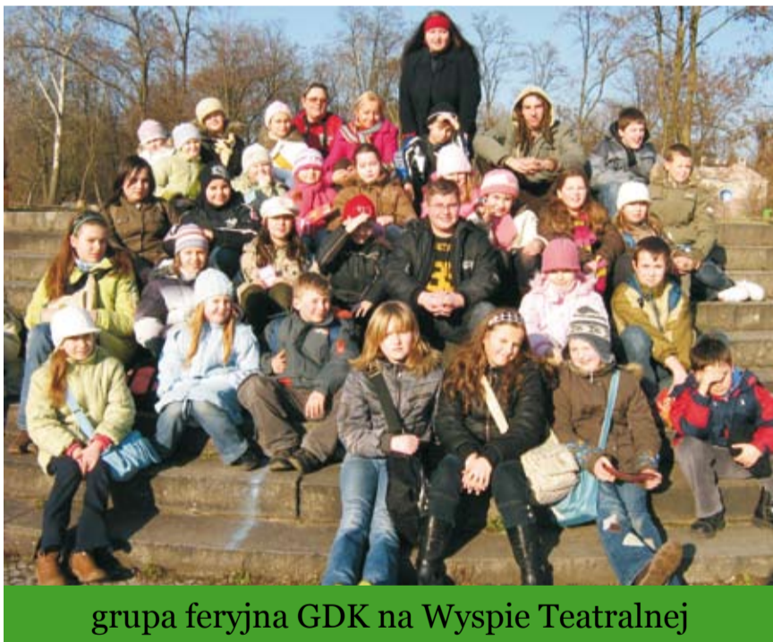
grupa feryjna GDK na Wyspie Teatralnej

wzbogacona została filmem. Ale w tym dniu najważniejsze było ognisko na Wyspie Teatralnej i poszukiwanie smerfnych jagód. Dla chętnych