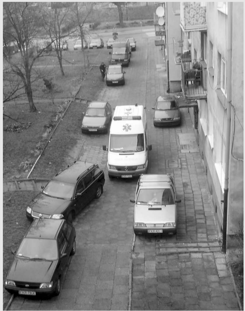
Karetka pod blokiem

Do chorego wezwana została karetka pogotowia ratunkowego – powiedziała pani A. – I proszę zobaczyć na zdjęciu, jaki ma utrudniony dojazd. Taka sytuacja jest pod blokami przy ul. Roosevelta 1 i 3.