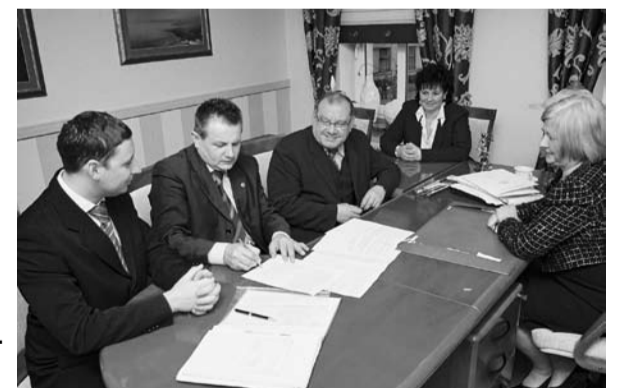
Na zdjęciu moment podpisania aktu notarialnego

Budynek będący od początku istnienia siedzibą instytucji został sprzedany za kwotę stanowiącą 10 % jego wartości mimo iż miasto Zielona Góra było skłonne oddać na jego siedzibę jeden ze swoich reprezentacyjnych budynków za darmo! Tym samym Euroregion „zawarł związek małżeński” z Gubinem na dobre i na złe! Na marginesie pozostaje jednak pytanie, dlaczego podjęto decyzję o sprzedaży budynku za taką kwotę, a nie symboliczną złotówkę?