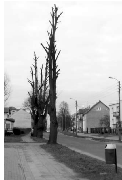
Przy ul. Żymierskiego żałośnie sterczą kikuty drzew po „zabiegach pielęgnacyjnych”.

Czas jakiś temu Gazeta Lubuska doniosła, że dendrolodzy są przeciwni ogławianiu drzew. W tym samym temacie wypowiedzieli się drogowcy przedstawiając odmienne stanowisko. Wniosek – drogowcy znają się na drzewach lepiej i... ogławiają. W Gubinie – jak leci. Efekty „racji” drogowców można obejrzyć w wielu miejscach miasta. Na osiedlu E. Plater sterczą kilkuletnie kikuty, obok